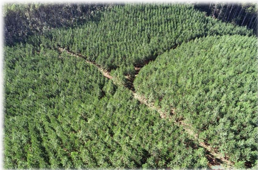
Figura 5 - Imagem aérea de área florestal com área plantada em formação.