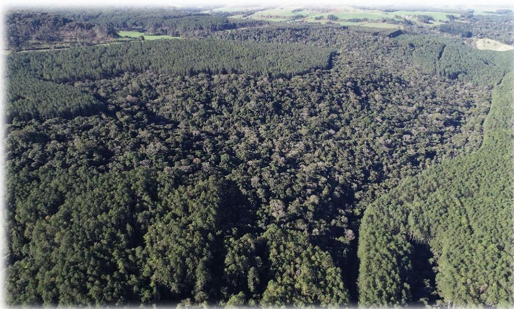
Figura 7 - Imagem aérea com a presença de remanescentes naturais e floresta plantada.

A Bragagnolo Florestal apresenta área total superior a 2.000 ha e destes, aproximadamente 600 ha são compostos por remanescentes naturais, os quais são preconizadas para sua manutenção e conservação.