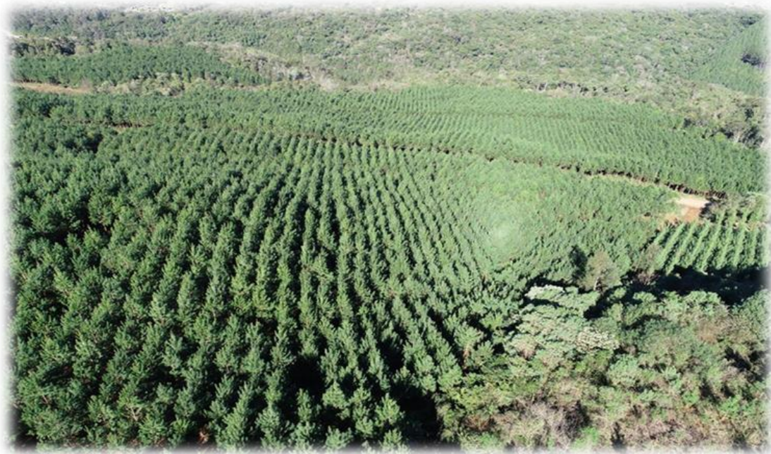
Figura 6 - Imagem aérea com plantio florestal.

O Inventário Florestal tem por objetivo o conhecimento quantitativo e qualitativo dos indivíduos que compõe as fazendas da empresa, a partir da alocação de amostras e mensuração dos indivíduos, permitindo o planejamento do uso dos recursos florestais.