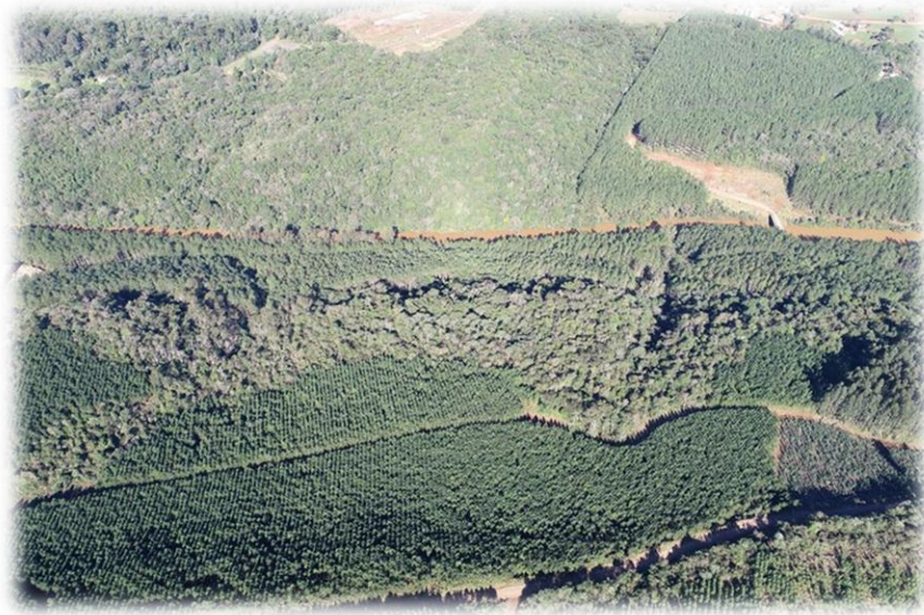
Figura 9 - Imagem aérea de plantios florestais e remanescentes de vegetação natural.