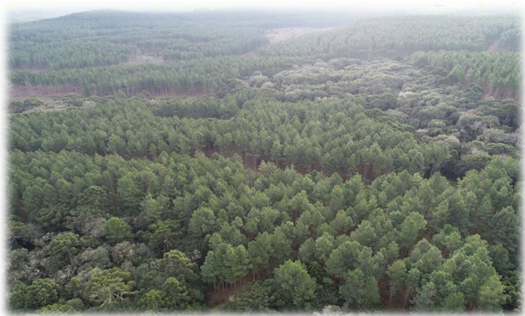
Figura 4 - Detalhe de áreas florestais da Bragagnolo Florestal.

Das comunidades identificadas, a mais próxima e mais importante é a Barra Grande, onde está localizada a empresa Avelino Bragagnolo. A comunidade é um distrito do Município de Faxinal dos Guedes, o qual possuía, em 2010, segundo o censo demográfico do IBGE, aproximadamente 1625 habitantes. Caracteriza-se por ser uma importante localidade para o Município de Faxinal dos Guedes, por sua concentração industrial. Destaca-se na economia local pela produção de papel e embalagens.