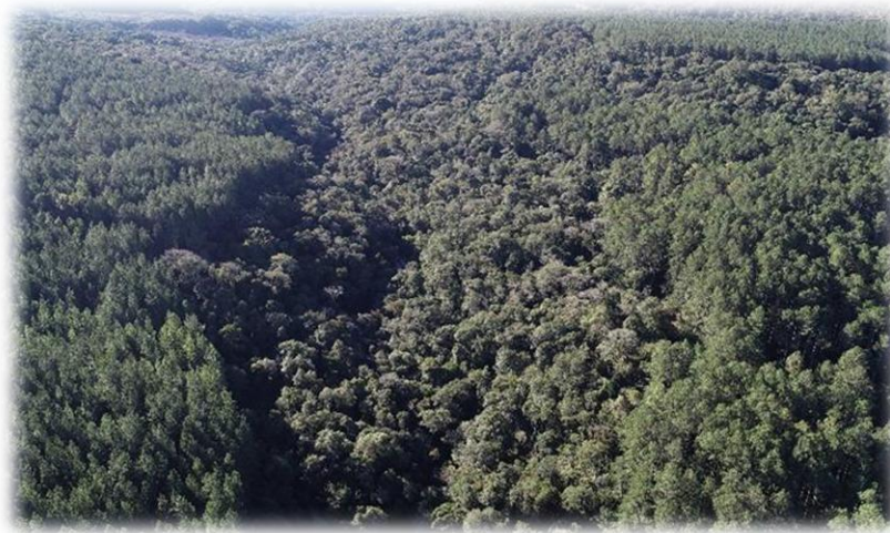
Figura 8 - Detalhe de APP em área da Bragagnolo Florestal.

Para informação e conscientização dos colaboradores, são dadas informações e treinamentos demonstrando as principais medidas que a empresa adota para proteção da fauna e flora, recursos hídricos e remanescentes naturais.