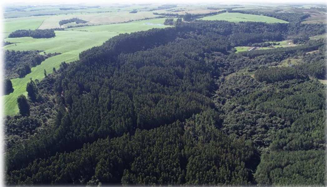
Figura 1 - Imagem aérea de florestas da Bragagnolo Florestal e remanescentes de vegetação natural.

Na década de 90 iniciou-se o plantio de milhares de pés de eucalipto, tendenciado pelo movimento do mercado, escassez de madeiras duras como imbuía e canela, juntamente com a proibição de derrubadas de árvores nativas. Atualmente, administra cerca de 1.700 ha de florestas próprias e aproximadamente 240 ha de florestas em regime de parceria em áreas arrendadas, com idades variadas.