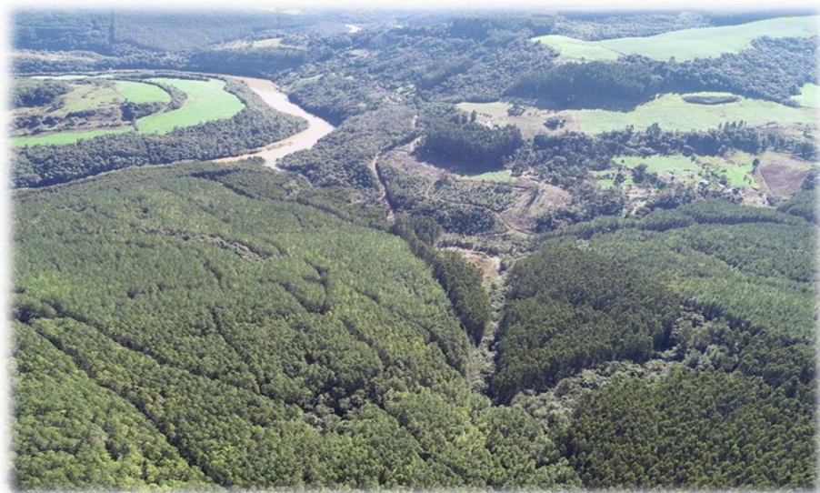
Figura 2 - Imagem aérea detalhando áreas da Bragagnolo Florestal.

A Bragagnolo possui (6) seis áreas que estão no escopo da certificação, sendo que (1) uma delas são operadas por meio de parceria. As fazendas, identificadas como Unidades de Manejo Florestal (UMF), estão situadas no estado de Santa Catarina, nos municípios de Faxinal dos Guedes, Vargeão e Herval d’Oeste.